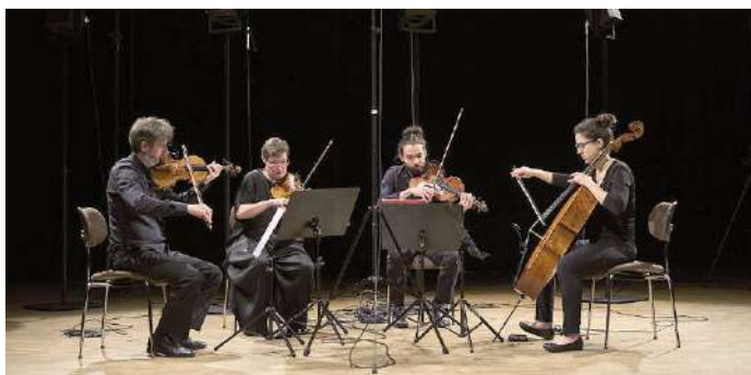
Le Quatuor Béla.

Commande du Quatuor Béla à la compositrice italienne Francesca Verunelli, Andare fut créée en 2024 à Paris. Les archets bruissent, froissent, pépient ou grincent dans un mirage sonore sans tempo, dont la pulsation imaginaire pourrait être le rythme du cœur de chacun des auditeurs. Vers le milieu de l'unique mouvement de seize minutes, une certaine éloquence émerge de ce glaciais, sous forme de bulles, d'ondulations ou d'aspérités dont la nuance dépasse rarement le mezzo-piano. Ni narrative ni descriptive, comme venue des limbes de la sensualité, cette pièce avance avec sérénité, se métamorphosant au gré d'émotions inspirées par des