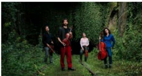
Le Quatuor Béla se produira au théâtre du Rossignolet, samedi 25 avril.

Au programme, des pièces de John Zorn, Morton Feldman, Harry Partch, Ruth Crawford Seeger, Conlon Nancarrow, et bien sûr, Moondog lui-même.